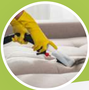
LAVADO DE MUEBLES Y SILLAS