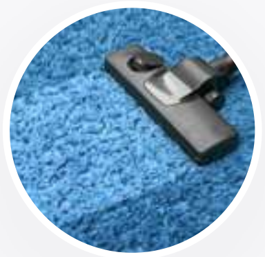
LAVADO Y ASPIRADO DE ALFOMBRAS