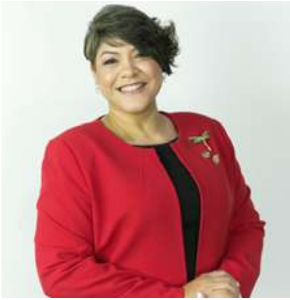
Por: Lic. Neris M. Ramos Acevedo, Mestre em Ciências da Gestão

Além de promover jornadas corporativas de plantio de árvores em locais aleatórios — onde, muitas vezes, não é necessário, e sim conveniente para a logística do evento —, a empresa socialmente responsável se preocupa em gerar resultados duradouros, com a implementação de mudanças sistêmicas que garantam a sustentabilidade. Essas mudanças vão desde a implementação de políticas para evitar a impressão desnecessária em papel, digitalização de documentos para eliminar grandes acúmulos de arquivos físicos e a implementação de energia limpa, entre outras.