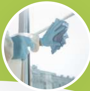
LIMPIEZA EN GENERAL