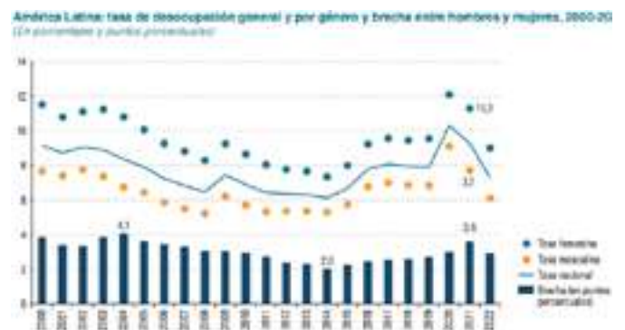
Figura 1: Taxa de desemprego geral e por gênero e disparidade entre homens e mulheres 2000-2022 (em pontos percentuais e percentuais). Fonte: CEPAL/OIT

Se analisarmos o caso de ocupação de emprego segundo gênero, temos estatísticas pouco animadoras, como mostra a Figura #1. Na América Latina, a taxa de desemprego mostra uma grande diferença entre homens e mulheres, como pode ser visto em números oficiais e dados da Organização Internacional do Trabalho (OIT).