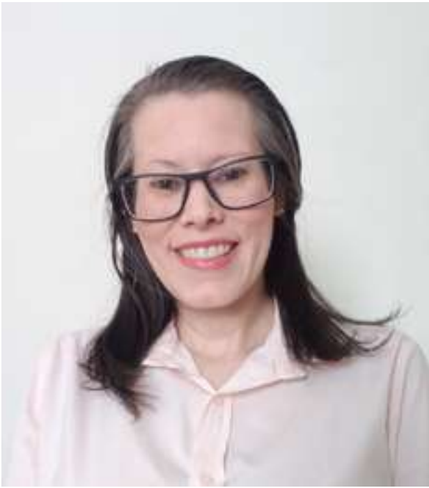
Por: Lic. Juliana Nascimento

O conceito de Responsabilidade Social representa muito mais que uma oportunidade de expansão da visibilidade e melhoria da imagem corporativa, e, por isso, ocupa cada vez mais espaço na agenda das empresas.