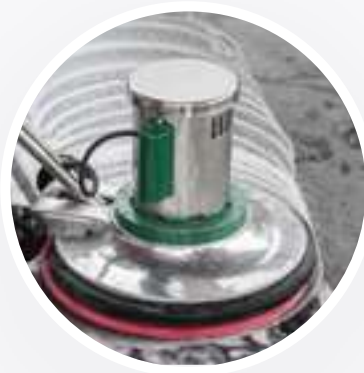
LAVADO, CRISTALIZADO Y PULIDO DE PISOS