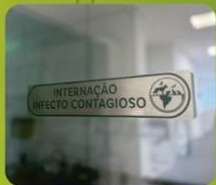
INTERNAÇÃO INFECTO CONTAGIOSA