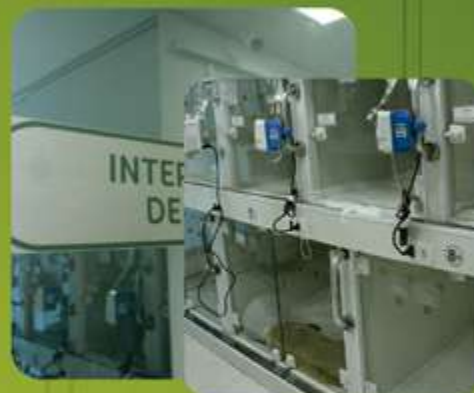
INTERNAÇÃO DE CÃES