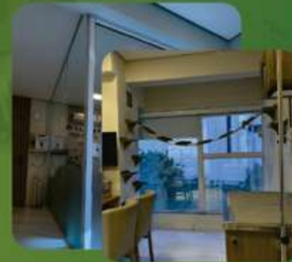
ESPAÇO PARA FELINOS