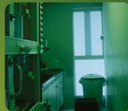
INTERNAÇÃO DE FELINOS