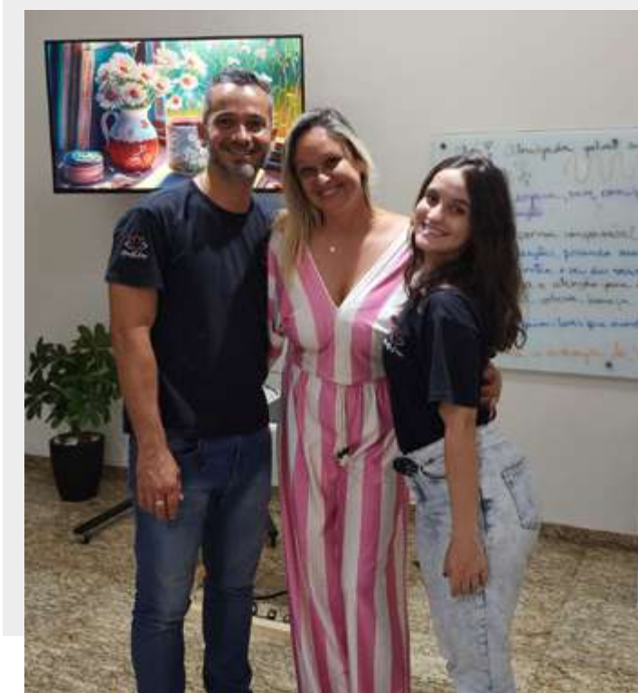
Equipe Instituto Atenção Plena