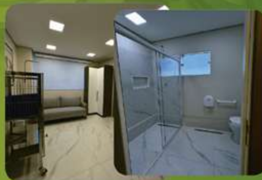
SUÍTE DO TUTOR